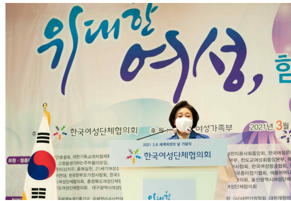
축사(박영선 더불어민주당 서울시장후보)