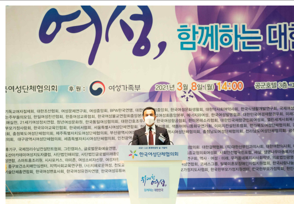
축사(주한 아랍에미리트 Abdulla Saif ALNUAIMI(압둘라 샤이프 알 누아이미)대사)