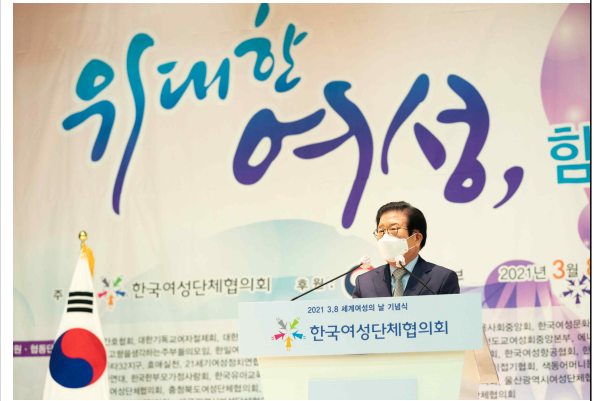
축사 (박병석 국회의장)