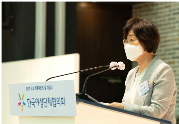
축사(정영애 여성가족부 장관)