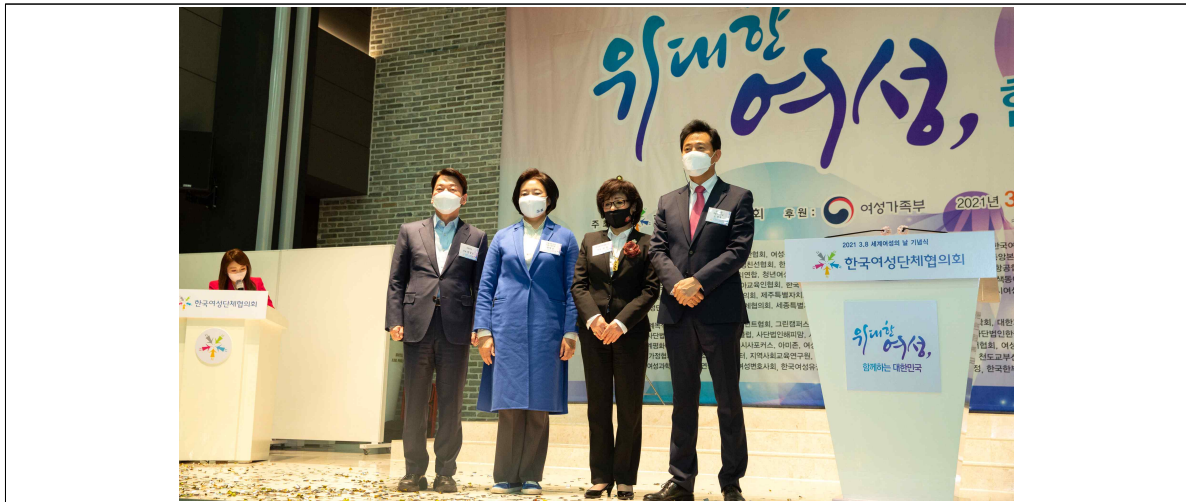
허명희장 및 서울시장 후보 단체사진