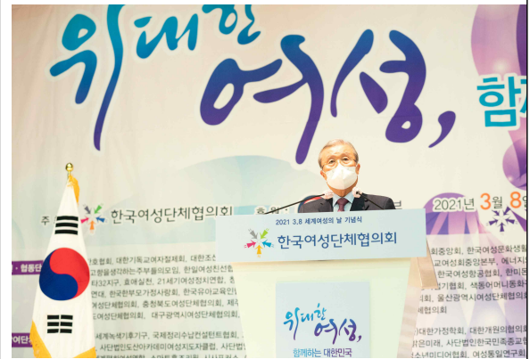
축사(김종인 국민의힘 비상대책위원장)