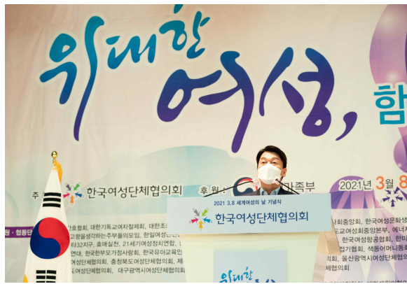
축사(안철수 국민의당 당대표)