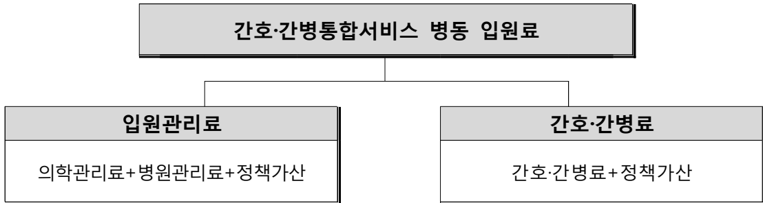
그림 1. 간호·간병통합서비스 병동 입원료 구성

나. 간호·간병통합서비스 병동 입원료는 입원관리료와 간호·간병료로 구성된다.